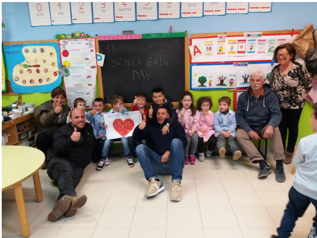
Foto di gruppo con i puzzle completati