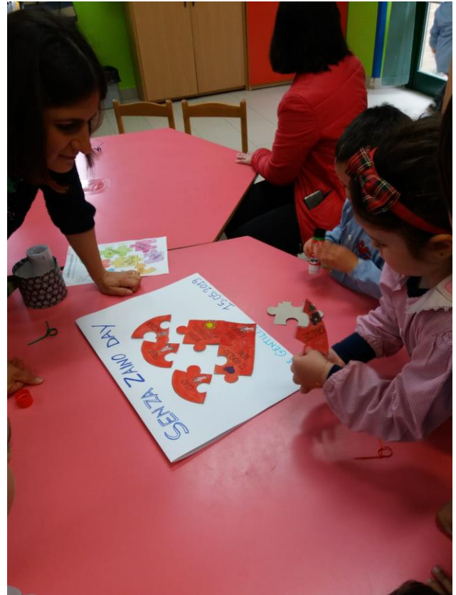
I due gruppi ricostruiscono i puzzle