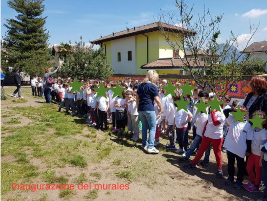
Inaugurazione del murales